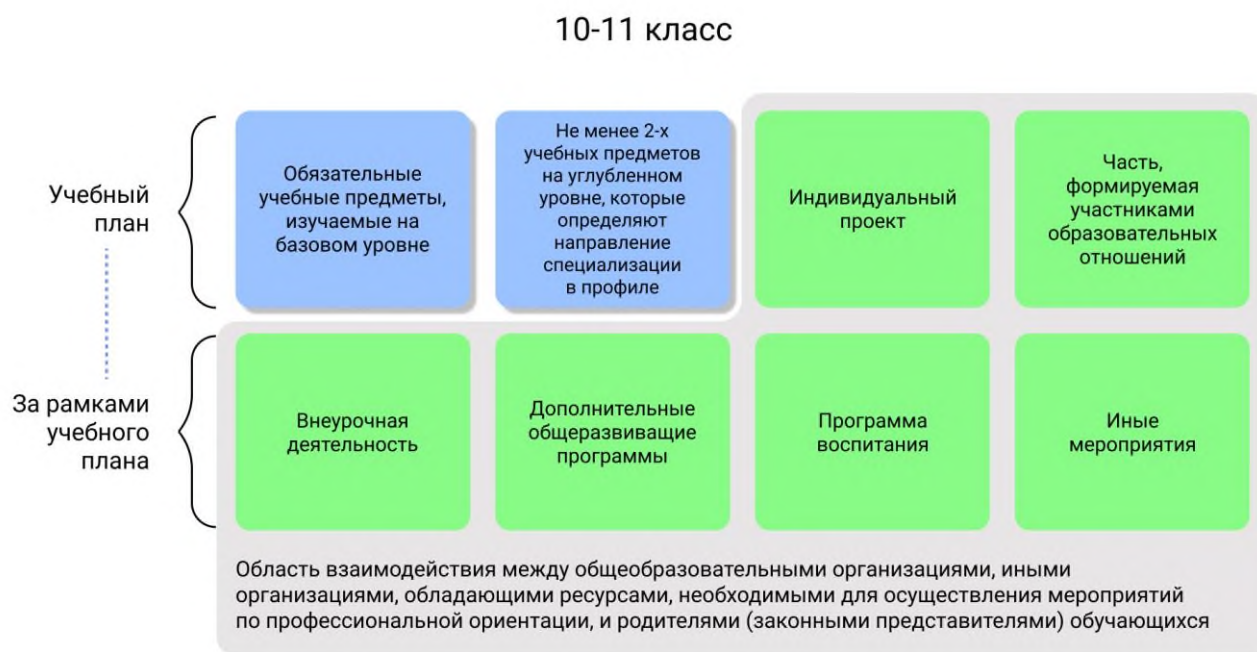
Рисунок 1 – Единая модель профориентации в профильных предпрофессиональных классах – область взаимодействия между общеобразовательными организациями и партнерами

Разработка основной образовательной программы для профильных предпрофессиональных классов проводится с учетом мнения всех категорий участников Единой модели профориентации, представленных на уровне субъекта Российской Федерации, муниципалитета.